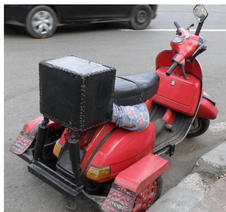
Vespa Egyptienne à 4 roues