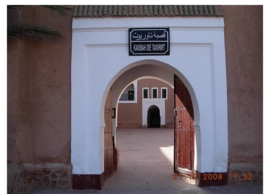
Kasbah de Taouarir